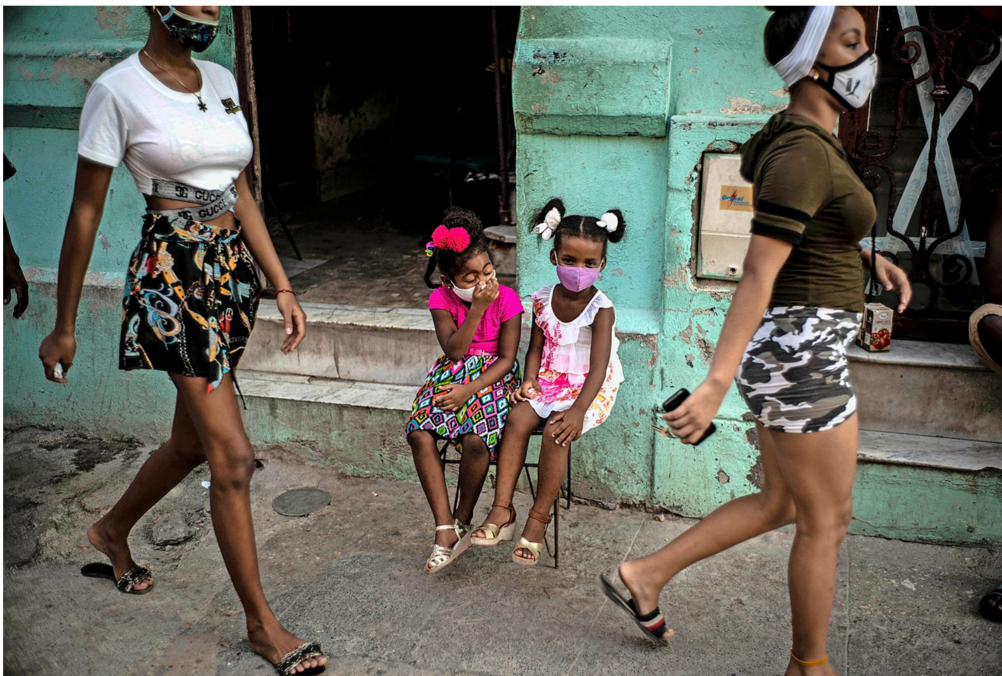
Der Pandemie begegnete Kuba mit harten Massnahmen: Maskenpflicht in der Hauptstadt Havanna

Der Tourismus steht still: Drei Schweizerinnen, die in Schweden, Patagonien und auf Kuba Gäste betreuen, erzählen