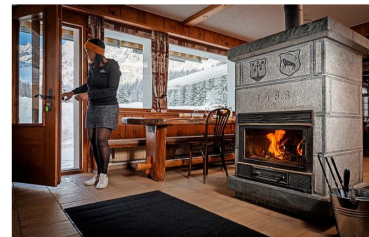
Heimeliges Berghotel: Das Relais d'Arpette liegt abgeschieden mitten in der Natur; in der Gaststube spendet ein Kaminfeuer Wärme