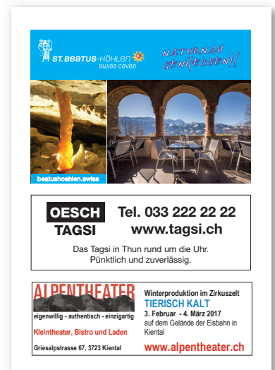
Beispiel für 1/2 und 1/4 Seite Inserate