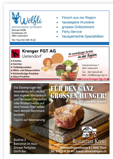
Beispiel für 1/4 Seite Inserat