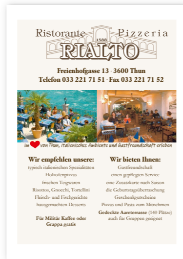
Beispiel für 1/1 Seite Inserat