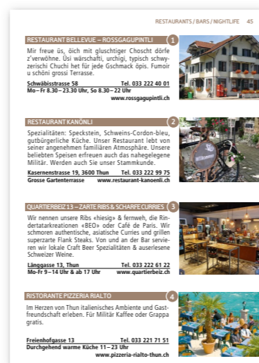
Beispiel für Rubrik Seite