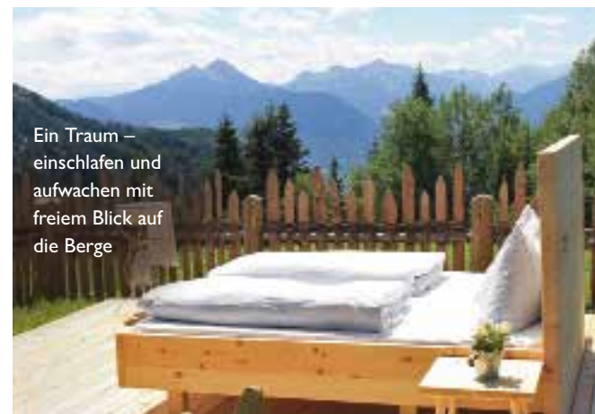
Ein Traum – einschlafen und aufwachen mit freiem Blick auf die Berge

Es war einmal ein Hotelier, der hat sich für seine naturverbundenen Gäste etwas ganz Besonderes einfallen lassen ... Nein, das ist nicht der Beginn einer entspannenden Gutenachtgeschichte, vielmehr ist es die Geschichte über ein spannendes Übernachtungsangebot. Zwischen Juni und August erfüllt das „Hotel Hohenwart“ in Südtirol nämlich den Traum vom komfortablen Schlafen unter freiem Himmel in lauen Sommernächten. Bequem gebettet und ausgestattet mit einem gut gefüllten Picknickkorb, kann man den Sonnenuntergang in aller Stille genießen und erleben, wie intensiv die Sterne nachts in den Bergen funkeln. Auch für die sanfte Landung in der Zivilisation ist gesorgt: Am nächsten Morgen wird das Frühstück im „Berggasthof Gsteier“ serviert. Das Angebot „Unterm Sternenhimmel“ mit vier Übernachtungen im „Hotel Hohenwart“ inkl. Verwöhnpension, davon eine Open-Air-Nacht u. v. m., kostet ab 818 Euro p. P. Infos: www.hohenwart.com