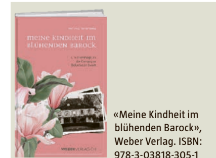
«Meine Kindheit im blühenden Barock», Weber Verlag. ISBN: 978-3-03818-305-1