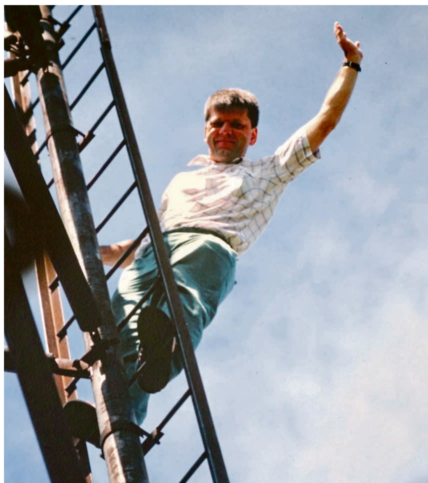
Der Autor beim Aufstieg auf einen wackeligen Aussichtsturm, von dem aus man das ganze zentrale Lettland überblickte. Brigitte Bögli Kuhn

Eine Velotour durch Estlands grösste Insel Saaremaa führte uns zurück in frühere Zeiten. Die Übernachtungen liessen wir uns vom lokalen, klei-