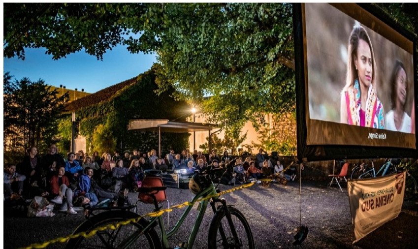
Nicht nur für Cineasten eine Freude: das Cinema Sud auf dem Gelände von Schloss Meggenhorn.

Meggen Cinema Sud, das Open-Air-Kino von Helvetas, kommt ganz umweltfreundlich daher: Die Kinoperateurinnen radeln mit Velos und Anhängern nach Meggen und laden tagsüber ihre mobilen Solarpanels für die beiden Abende. An einem lauschigen Ort im Schlosspark spannen sie die Kinoleinwand auf und zeigen zwei Filme, die kritisch hinter die Kulissen der «fast fashion» blicken. Gefilmt auf der ganzen Welt, zeigt die Dokumentation eindrücklich die Kluft zwischen dem Scheinwerferlicht der Catwalks und