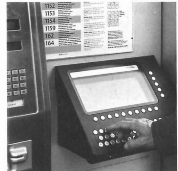
Senioren und Seniorinnen lernen in einem Volkshochschulkurs mit dem elektronischen Telefonbuch umzugehen.