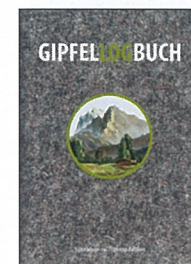
Marion Meyer / Dominik Prantl Gipfelglogbuch Ordnung muss sein – auch auf dem Weg zum Gipfel

320 Seiten, Hardcover mit Filzbezug, 14,2 x 19,6 cm, CHF 29.90, ISBN 978-3-86615-968-6, Süddeutsche Zeitung Edition, München 2012, www.sueddeutsche.ch