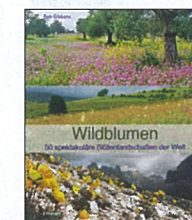
Bob Gibbons Wildblumen 50 spektakuläre Blütenlandschaften der Welt

288 Seiten, 11,4 x 18 cm, CHF 14.90, ISBN 978-3-257-24186-0, Diogenes Verlag, Zürich 2012, www.diogenes.ch