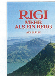
Adi Kälin Rigi Mehr als ein Berg

176 Seiten, Hardcover mit Schutzumschlag, 17 x 24 cm, CHF 54.–, ISBN 978-3-909111-96-1, AS-Verlag, Zürich 2012, www.as-verlag.ch