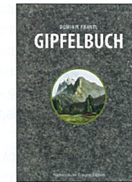
Dominik Prantl Gipfelbuch Von der Kunst auf einen Berg zu steigen

288 Seiten, Pappband mit Schutzumschlag, 23 x 30 cm, CHF 68.–, ISBN 978-3-03919-245-8, Verlag Hier+Jetzt, Baden 2012, www.hierundjetzt.ch