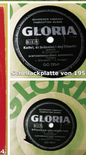
Schellackplatte von 1954.