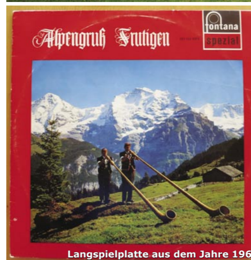
Langspielplatte aus dem Jahre 1964.