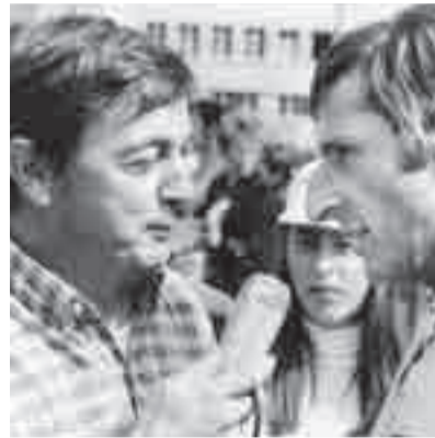
Immer wieder auf Nasenhöhe mit Radlegende Ferdi Kübler.

glänzen (23 Medaillen), sondern auch Sepp Renggli mit seinen Berichten. 1953 wechselt er von der primär schreibenden Zunft zum Radio, wo er als Stimme des Sportes zur Legende werden wird. Er erwischt die grosse Zeit des Schweizer Radsports, der eine seiner grossen Leidenschafts bleiben wird. Er trifft sie alle, die Kübler und Koblets, auch die ausländischen Stars. An vorderster Front erlebt er weitere Grossanlässe, Weltmeisterschaften, Olympische Spiele im Sommer und Winter, über die er nicht nur berichtet, sondern auch Bücher schreibt. Und die Grossen, denen er begegnet, kommen längst nicht mehr nur aus dem Radsport: Sir Stanley Matthews, Muhammad Ali, Roger Federer und, und, und.