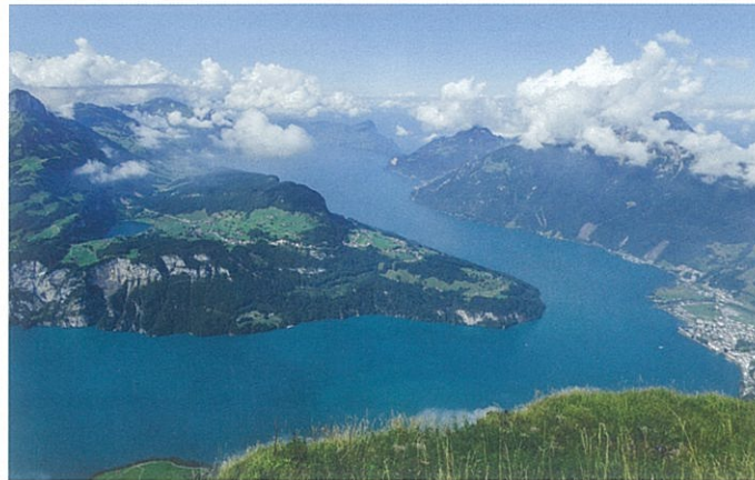
Eindrucklich war die Aussicht von der Sesselbahn auf den Fronalpstock.

bhw. Aus fast allen 27 angeschlossenen Vereinen nahmen Landfrauen an der ersten OLV-Reise auf den Fronalpstock teil. In Gisikon, an den Ufern der träge fließenden Reuss, wartete im Gasthof Tell ein feiner Kaffee mit einem knusprigen Gipfeli auf die Landfrauen. Weiter ging die Fahrt Richtung Zugerland. In Rysch wurden die teilweise mondänen Villen bewundert und vorbei an Küsnacht und Arth gings nach Seewen im Kanton Schwyz. Bei der Bahnstation Schlattli stieg man auf die 1933 erbaute Schmalspur-Standseilbahn Schwyz – Stoos um. Die Spurbreite beträgt nur 800 mm. Dieselbe Spurbreite haben ebenfalls die Standseilbahn auf den Stoos und die Marzilbahn in Bern. Die Stoosbahn erreicht