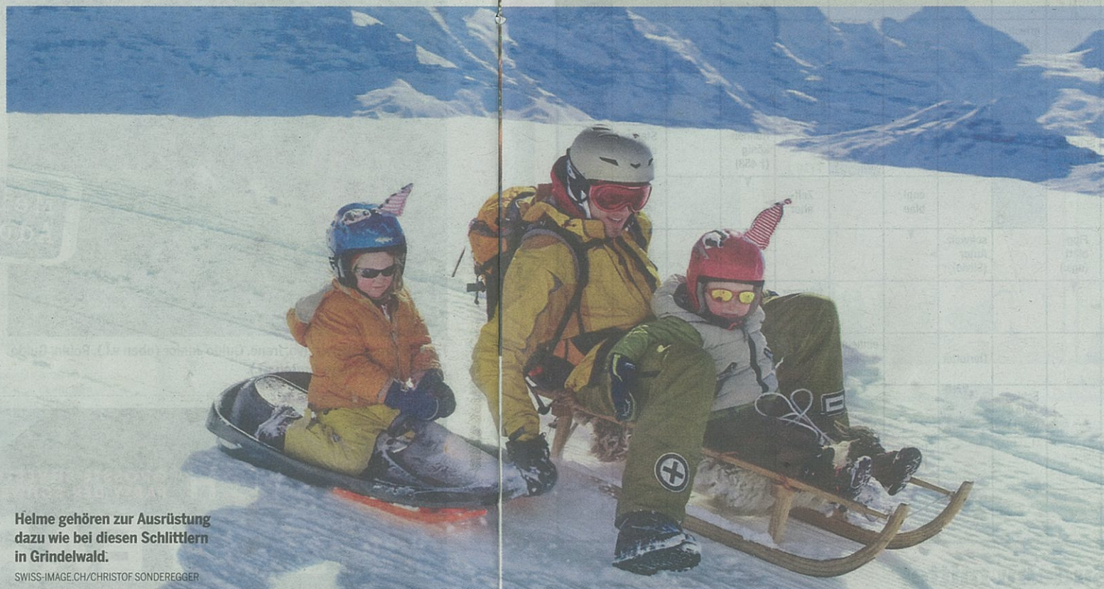
Helme gehören zur Ausrüstung dazu wie bei diesen Schlittlern in Grindelwald.