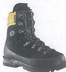
Haix 602301 Protector Alpin