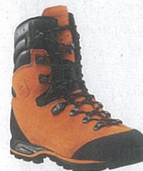
Haix 603101 Protector Forest