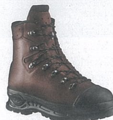
Haix 602007 Trekker Mountain S3