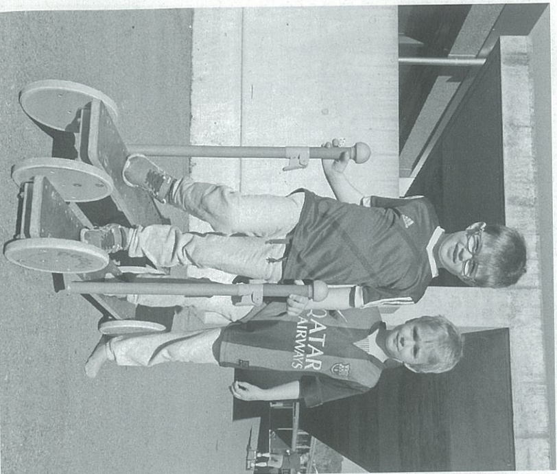
Pedalo fahren zu zweit.

Erstes Kinder-Riegen-Plausch-Turnen in Steckborn am vergangenen Freitag war ein Erfolg