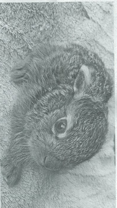
Junger Feldhase von Passanten aufgegriffen, welcher nun im tiermedizinischen Zentrum in Mülheim aufgezogen werden muss.

Der Tierschutzverein Steckborn informiert: Kleine Feldhasen nicht anfassen, sonst nimmt sie die Mutter nicht mehr an