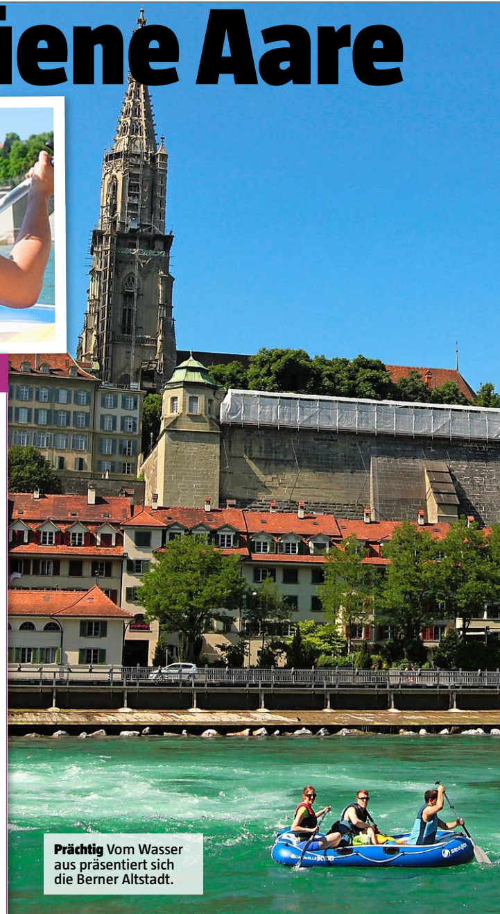
Prächtig Vom Wasser aus präsentiert sich die Berner Altstadt.