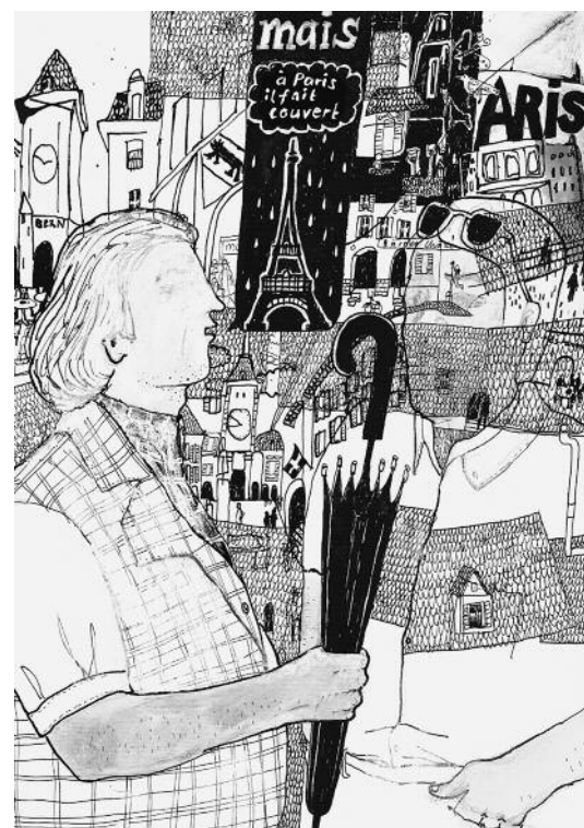
▲ Die Kurzzusammenfassung der Anekdote: Ein französischer Diplomat führt auch bei hellstem Sonnenschein in Bern den Regenschirm mit sich, weil in Paris der Himmel bedeckt ist.