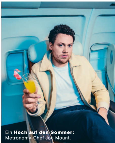
Ein Hoch auf den Sommer: Metronomy-Chef Joe Mount.