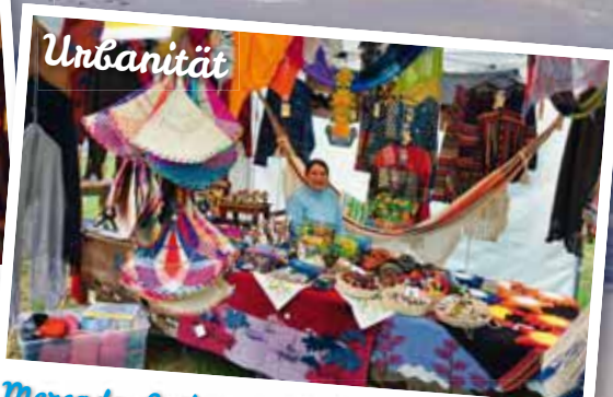
Mercedo Latino - exotisch und kuntenbunt