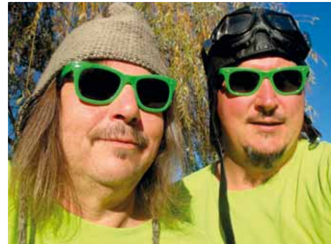
Freitag ab 19.00 Uhr Duo Liederling