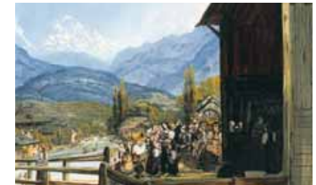
Johann Ludwig Bleuler: Brückenzoll auf der Schalbrücke, um 1810.