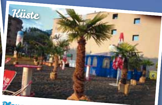
Playa - zum Erholen und Relaxen