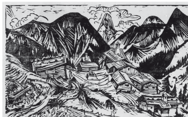
Ernst Ludwig Kirchner, Stafelalp, 1917, Holzschnitt, 44,5 x 57 cm, Sammlung EWK

Sonntag, 3. Juli bis Sonntag, 9. Oktober 2016