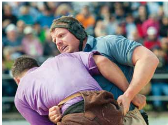
Glarner in Action: Kraft, Konzentration und Technik!

Sport war, ist und bleibt in Zukunft wohl ein wichtiger Bestandteil in meinem Leben. Es war mir immer wichtig, neben der körperlichen Betätigung auch etwas für den Geist zu tun. So arbeitete ich nebst dem Studium in einem Teilzeitpensum im Bildungszentrum Interlaken (BZI) als Turn- und Sportlehrer. Momentan habe ich das Privileg, bei den Bergbahnen Meiringen Hasliberg arbeiten zu dürfen und ich werde in naher Zukunft eine weitere Ausbildung beginnen. Genaueres möchte ich dazu jetzt noch nicht sagen.