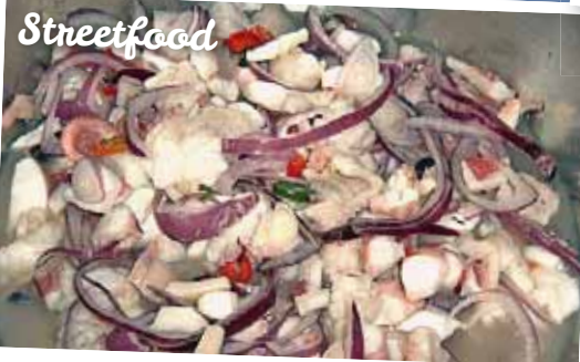
Latino Küche - vielseitig und köstlich