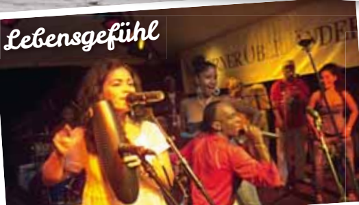
Livemusik - Tanze dich in den Süden