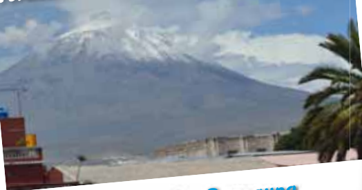
Kletterhalle - aktive Bewegung