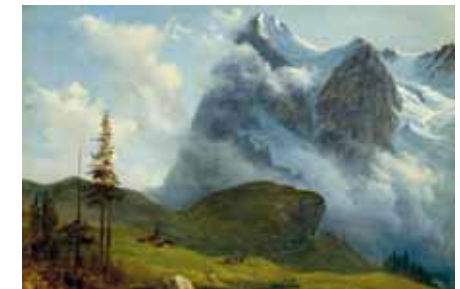
Francois Diday: Eigerwand et glacier de l'Eiger, um 1850.

Öffnungszeiten: Mittwoch–Samstag, 15 bis 18 Uhr, Sonntag, 11 bis 17 Uhr, Montag und Dienstag geschlossen