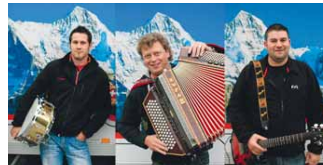
Samstag ab 19.00 Uhr Bermudas Party- & Coverband