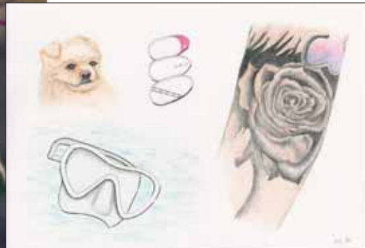
Illustration: Irene Guinand

So sind Sie dabei: Senden Sie uns bitte den Namen der gesuchten Person als Lösung mit Ihrem Namen, Ihrer Adresse und Telefonnummer an: Weber AG, Wettbewerb BodeliInfo/BrienzInfo, Gwattstrasse 144, 3645 Gwatt oder: wettbewerb@weberag.ch