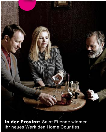
In der Provinz: Saint Etienne widmen ihr neues Werk den Home Counties.