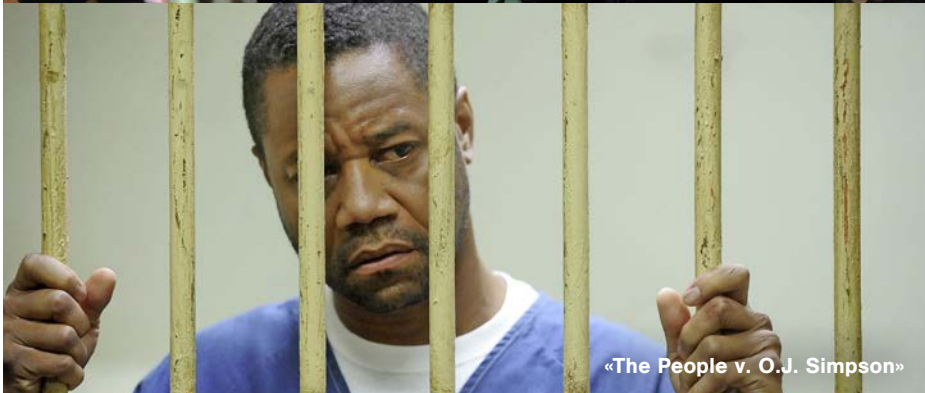
«The People v. O.J. Simpson»