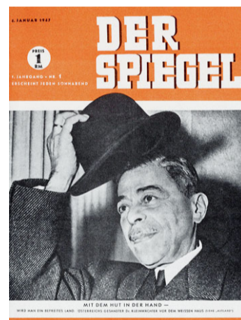
4. Januar 1947: Das Titelbild der ersten «Spiegel»-Ausgabe.

Das müssten Journalisten in Zeiten wie diesen, in denen Demokratie derart ernsthaft infrage gestellt werde, noch viel mehr sein. «Lügner müssen Lügner genannt werden, und Rassisten sind