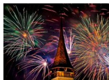
Feuerwerk am Fest. Markus Hubacher

Feuerwerk, Flugshow und viel Musik: All das darf am Seenachtsfest in Spiez nicht fehlen. Auch in diesem Jahr wurden die Besucher mit einem grossen Angebot begeistert. Bands wie Troubas Kater und Calimeros brachten die Bucht zum Kochen. Neu gab es auch einen Gästebereich für VIPs und einen Kinder-Funpark. Als besonderes Highlight bei der diesjährigen Ausgabe durften alle