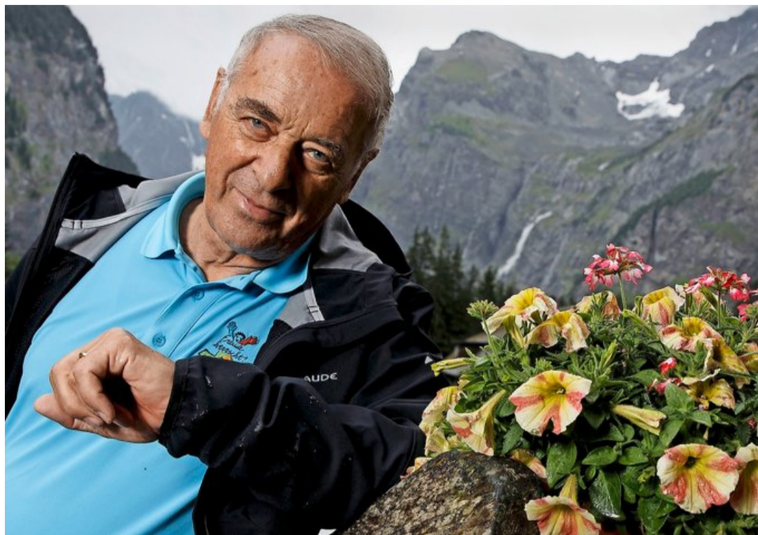
Naturbursche und Naturtalent des öffentlichen Auftritts: Adolf Ogi (75) in seinen Bergen.

In wirtschaftlicher Hinsicht sicher. Politisch ist er bis heute sehr stark. Ich gehöre in der SVP zu einer Minderheit. Ich hatte mit Blocher immer wieder Pro-