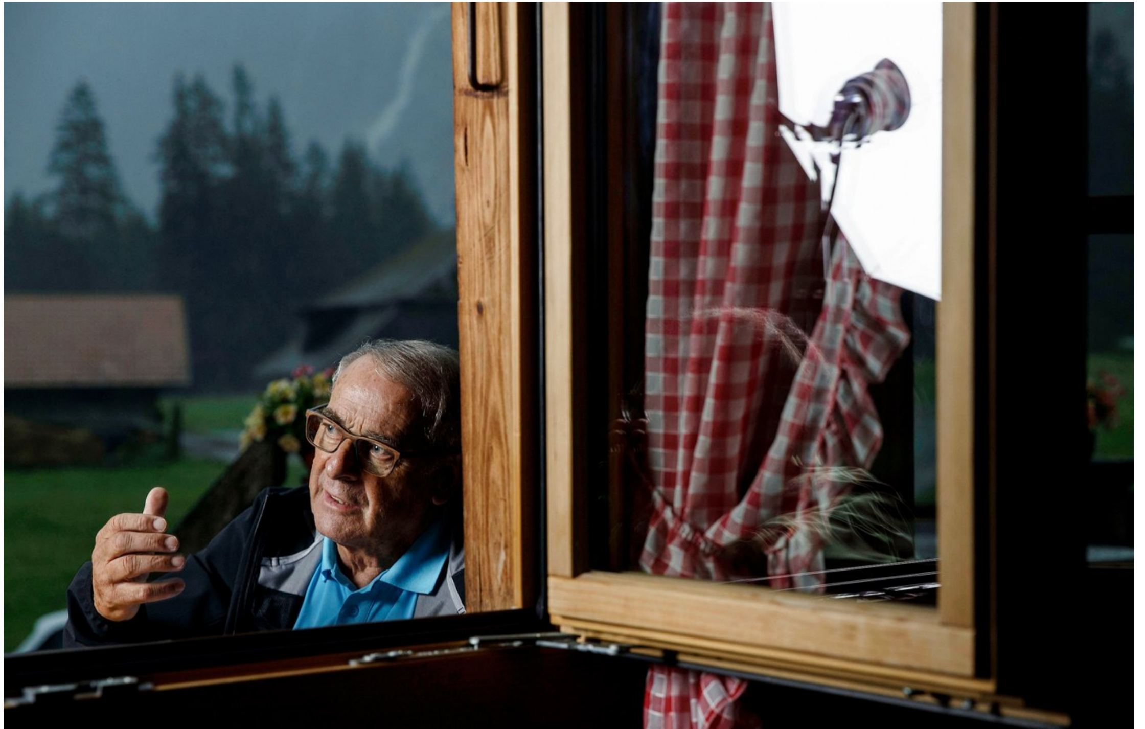
Im wilden Gasterntal hoch oben über seiner Heimat Kandersteg hat sich Adolf Ogi mit uns im Restaurant Waldheim zum Gespräch verabredet.