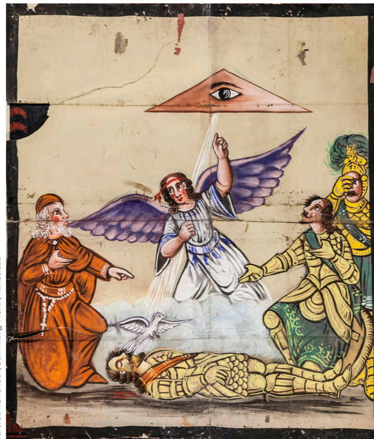
Tafel zu «Orlando», Sammlung Würth, Kinzelsau