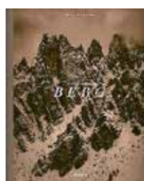
«Berg...», Uli Wiesmeier, Knesebeck, 328 Seiten, Fr. 99.–.

Mit 14 Jahren machte Uli Wiesmeier sein erstes Bild: ein Berg. In seiner Karriere als Werbefotograf und Foto-reporter hat er sich immer wieder alpinen Themen gewidmet. Der vorliegende opulente Band «Berg...» ist für ihn das wichtigste Fotoprojekt, an dem er vier Jahre gearbeitet hat. Er sammelte dazu 16 Begriffe wie Bergsteiger, Bergbahn, Bergbauer, Berghütte und so weiter und setzte sie fotografisch um. Herausgekommen ist ein Bildband mit ausserordentlich eindrücklichen Fotos. Entstanden ist eine ganz eigene Bergsicht, wenn er etwa Bergspitzen gleich geformten Wolkenkratzen in New York gegenüberstellt. bb