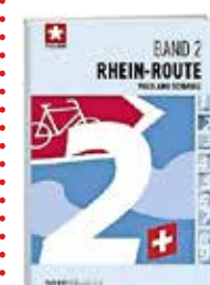
«Gesamtführer Veloland Schweiz», 632 Seiten, mit Velokarten, Fr. 49.–. «Rhein-Route – Veloland Schweiz», 104 Seiten, mit Velokarten, Fr. 25.–.

Das Veloland Schweiz wird nächstes Jahr 20 Jahre alt: Im Frühling 1998 wurde das Routennetz durch Bundesrat Adolf Ogi eröffnet. Schon damals gab es einen Reiseführer. Er wurde immer weiterentwickelt und aktualisiert. Heute gibt es den Gesamtführer, mit dem man das ganze Veloland Schweiz (zu Hause) erkunden und planen kann. Dazu gibt es Einzelbände, die sich einer der neun Routen durch die Schweiz widmen. Sie enthalten detaillierte Karten und eignen sich gut zum Mitnehmen. Band 2 zum Beispiel führt von Basel an den Bodensee und von dort aus weiter dem Rhein entlang bis nach Andermatt. bb