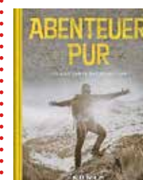
«Abenteuer Pur», Kunth, 304 Seiten, Fr. 43.90.

Zu Fuss oder auf Elefanten, im Auto oder im Segelboot, auf dem Wasser oder auf der Strasse: Das Buch «Abenteuer pur» ist eine Inspirationsquelle für Reiselustige. Es versammelt hundert einzigartige Ziele weltweit. Dazu gehören so unterschiedliche Reisen wie der Rundweg auf dem Mont Blanc, eine Wandersafari am Fluss Luangwa, eine Zugfahrt entlang der Ostküste von Madagaskar, eine Kajaktour bei den Äusseren Hebriden, eine Schifffahrt zu der Insel Komodo, eine Töffahrt dem Ho-Chi-Minh-Pfad entlang, Rafting im Grand Canyon oder zur Seilrutsche in Costa Rica. Zu jeder Reise gibts Informationen und Tipps. bb