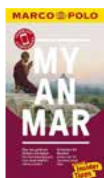
«Reiseführer Myanmar», Andrea Markand, Markus Markand, Marco Polo Verlag, 120 Seiten, ca. Fr. 14.–.

Marco-Polo-Reiseführer sind ideal für unterwegs: Klein und kompakt, übersichtlich und mit guten Falkarten und auch mit einem Touren-App passen sie in jede Gesässtasche. Im Oktober ist jetzt der Reiseführer für Myanmar neu erschienen. Ausserdem sind in einer aktualisierten Nachauflage folgende Destinationen lieferbar: Amsterdam, Föhr/Amrum/Pellworm/Nordstrand, Hamburg, Indien – Der Süden, Kreta, Languedoc-Roussillon/Cevennes, Mailand/Lombardei, Malaysia, Malta, Nepal, Normandie, Plattensee, Ruhrgebiet, Tokio, USA Südwest/Las Vegas/Colorado, Wien und Zákynthos/Itháki/Kefalloniá. pdm