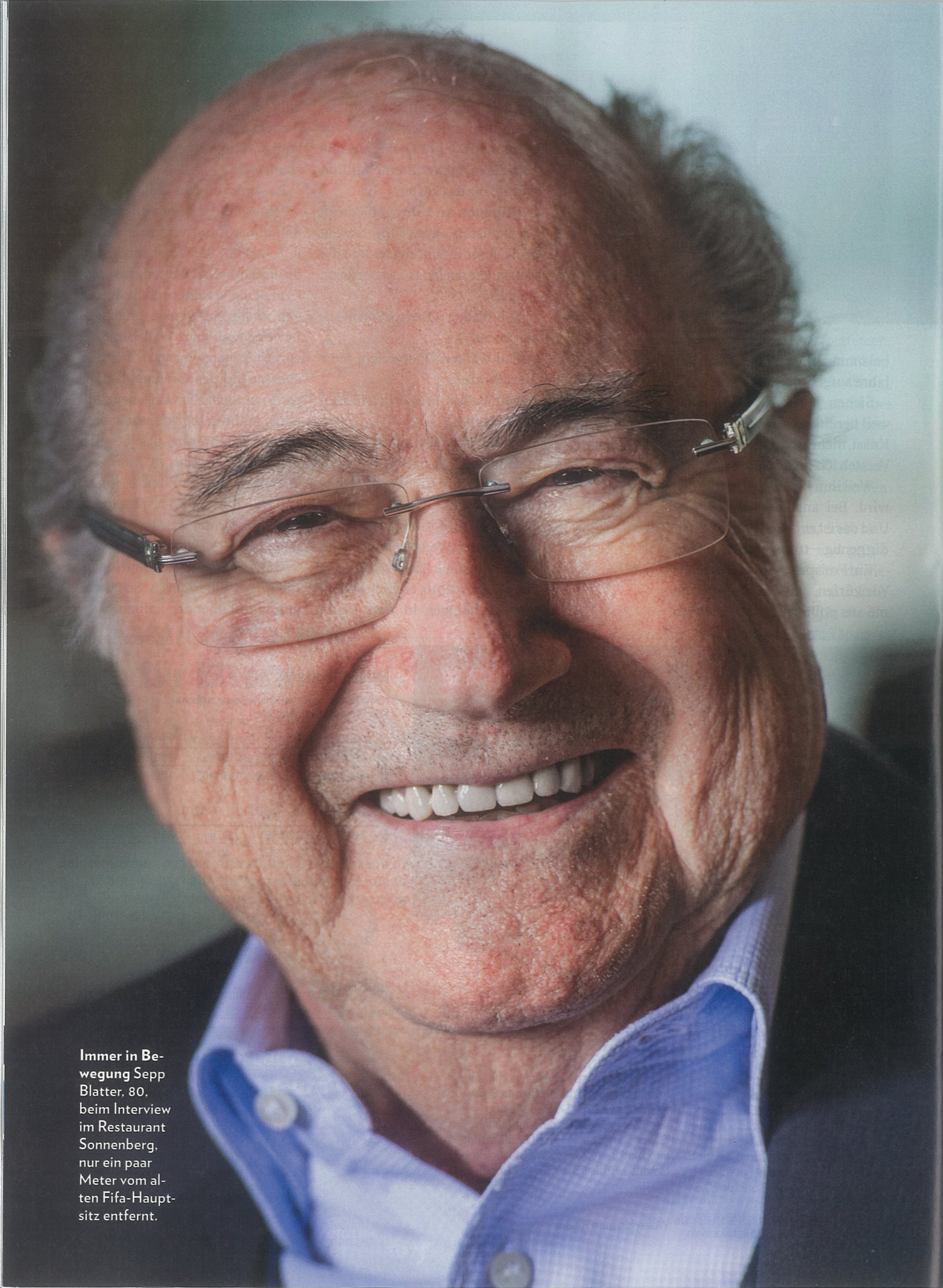
Immer in Bewegung Sepp Blatter, 80, beim Interview im Restaurant Sonnenberg, nur ein paar Meter vom alten Fifa-Hauptsitz entfernt.