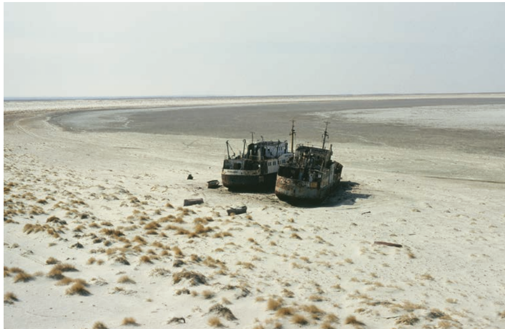
Das Aralseebecken bei Mujnjak ist inzwischen völlig ausgetrocknet

Als wir in der Stadt Turkistan Halt machten, wurden wir gleich zwei Mal Opfer von Trinkgelagen. Ein zweites Mal, nachdem wir uns bereits Schlafen gelegt hatten.