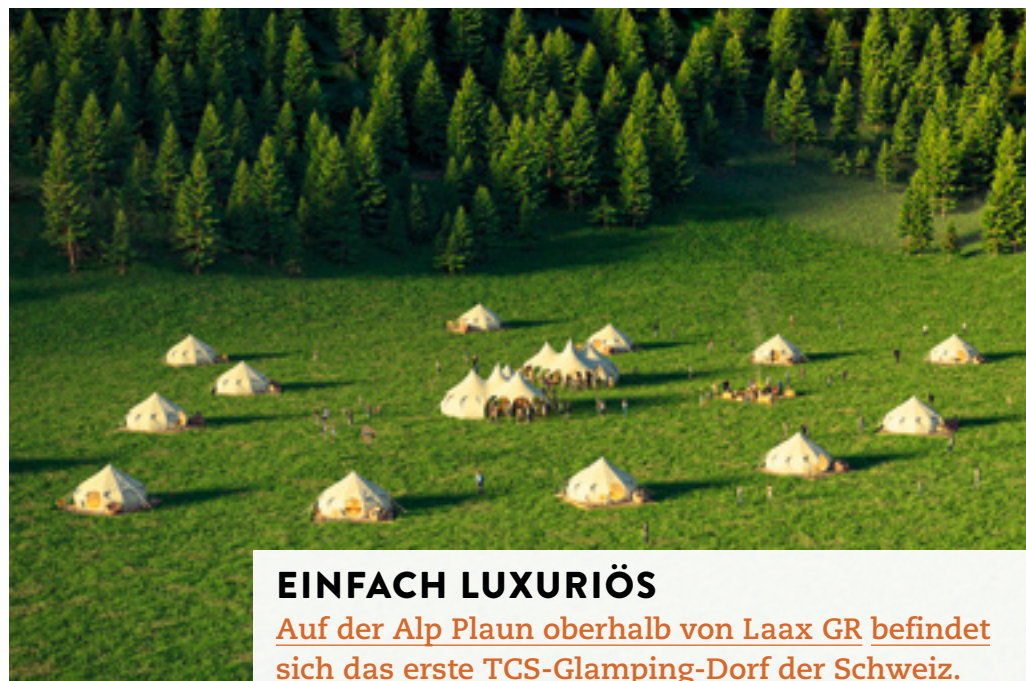
Komfortables Zelten in der Bündner Bergwelt.

Überragende Architektur und die Welt der Gebirge müssen sich nicht ausschliessen. So bildet etwa der Aluminiumbau der Monte-Rosa-Hütte oberhalb von Zermatt einen architektonischen Höhepunkt. Oder der Monolith aus Beton der Anenhütte im Lötschental. Im Buch «Architektur erwandern» werden 42 aussergewöhnliche Bauten vorgestellt mit den jeweiligen Routenvorschlägen. 49 Fr., Infos: www.werdverlag.ch