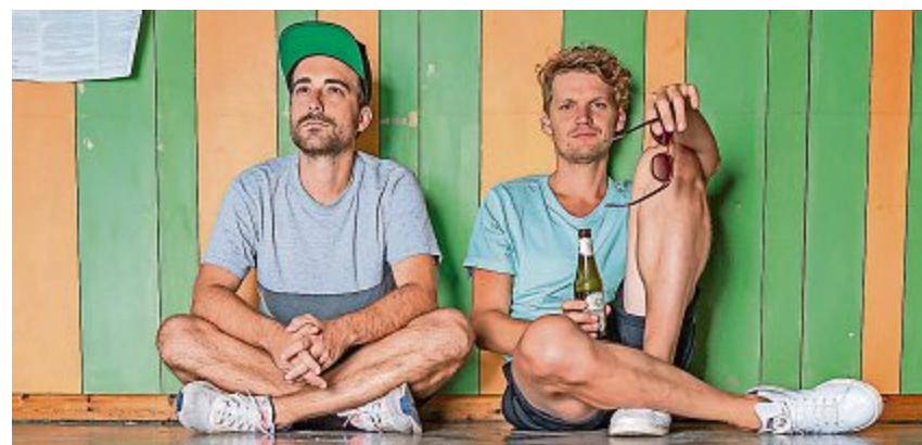
«Dabu Fantastic» gibt in jeder Lage eine gute Figur ab.

Eschenbach Das Dorf Eschenbach hat seit über 25 Jahren eine lange Festival Tradition mit dem OpenAir Eschenbach, Eihörnlifestival und der RockNight. Diverse internationale Bands wie Die Fantastischen Vier, James Brown, Zucchero, Status Quo, Candy Dulfer und nationale Bands wie Polo Hofer, Gottard, Züri West, Sina, Patent Ochsner, Philipp Fankhauser, Krokus und Les Sauterelles haben schon in Eschenbach aufgespielt. Mit dem Eschenbacher Festival will das Organisationskomitee an diese Tradition anknüpfen und konnten dafür Dabu Fantastic, Eliane und Stevans gewinnen. Das Konzert startet