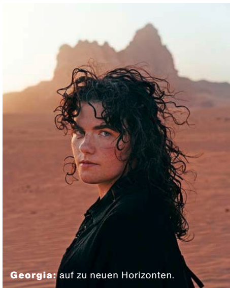
Georgia: auf zu neuen Horizonten.