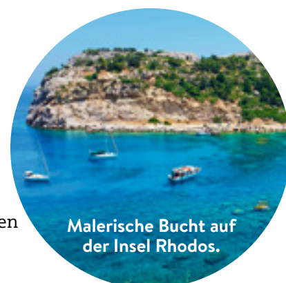
Malerische Bucht auf der Insel Rhodos.

Ponta Delgada auf den Azoren, das türkische Antalya, die Mittelmeerinseln Menorca und Rhodos sowie Djerba in Tunesien und das kroatische Dubrovnik. In diesem Sommer fliegt die Swiss diese beliebten europäischen Feriendestinationen auch ab Genf an. www.swiss.com