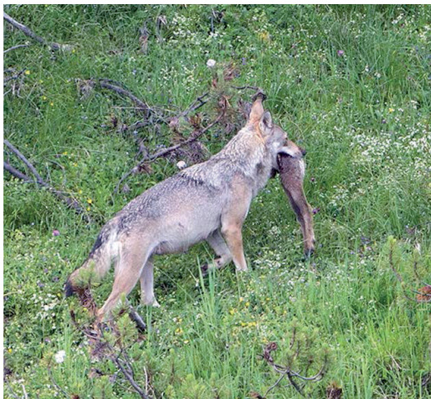
La mumma luf F07 tuorna suenter ina catscha sil Calanda cun in calun camutsch tier ses cagneuls.

Naven digl onn 2008 – 2019 ei in auter liug staus pil Peter da grond'impurtonza e quei il Yellowstone (USA) nua ch'el ei regularmein sin via per observar lufs e quei entochen il di dad oz. Yellowstone ei surtut impurtont per capir co ils lufs influenzeschan igl entir sistem