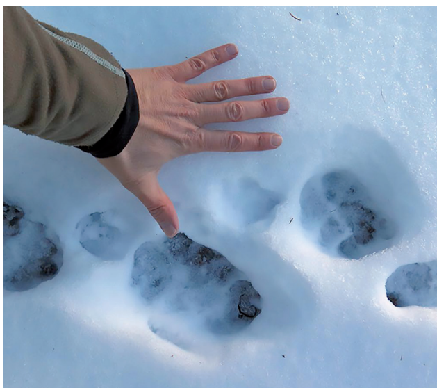
Cheu ves'ins la grondezia dils fastitgs dil luf.